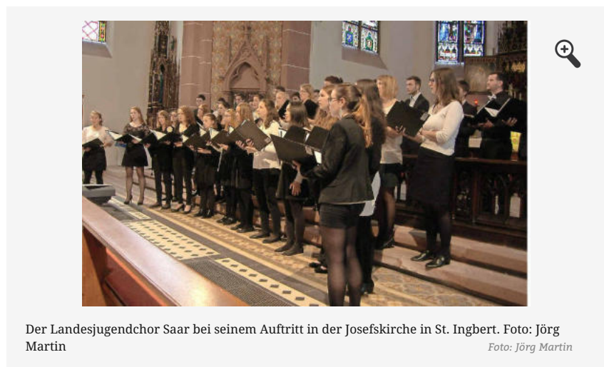
Der Landesjugendchor Saar bei seinem Auftritt in der Josefskirche in St. Ingbert.